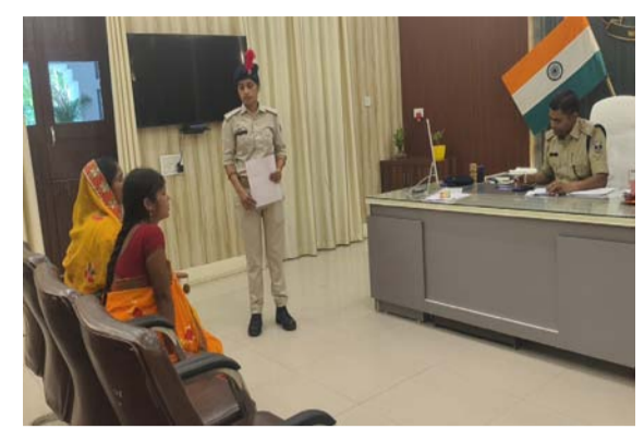
जुड़ी शिकायतों सामने आईं, जिन पर आवश्यक कार्रवाई के निर्देश मौके पर ही दिए गए। एसपी ने अधिकारियों को यह भी निर्देशित किया कि लंबित मामलों की नियमित समीक्षा कर शीघ्र निष्पादन सुनिश्चित किया जाए, ताकि लोगों को न्याय के लिए भटकना न पड़े।