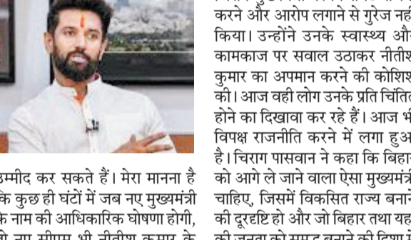
उम्मीद कर सकते हैं। मेरा मानना है कि कुछ ही घंटों में जब नए मुख्यमंत्री के नाम की आधिकारिक घोषणा होगी, तो नए सीएम भी नीतीश कुमार के अनुभव और मार्गदर्शन से राज्य को विकसित बिहार बनाने की दिशा में काम करेंगे। उन्होंने विपक्ष पर निशाना साधते हुए कहा कि वह वही विपक्ष है