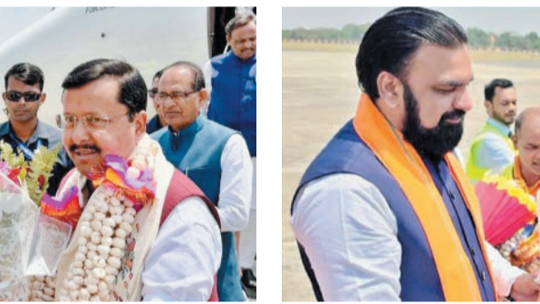
मिलाकर, पटना इस वक्त सियासी क्लाइमेक्स का गवाह बन रहा है जहां एक तरफ पुराने नेतृत्व की विदाई है, तो दूसरी तरफ नए चेहरे के स्वागत की पूरी तैयारी। अब सबकी निगाहें उस एक पेलान पर टिकी हैं, जो तय करेगा कि बिहार की सत्ता की चाबी आखिर किसके हाथों में सौंपी जाएगी।

आज एक युग का अंत, बिहार एक नई शुरुआत की ओर बढ़ेगा: चिराग