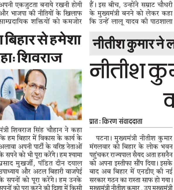
मंत्री शिवराज सिंह चौहान ने कहा कि हम बिहार में विकास के कार्य के अलावा अपनी पार्टी के वरिष्ठ नेताओं के सपने को भी पूरा करेंगे। हम श्यामा प्रसाद मुखर्जी, पंडित दीन दयाल उपाध्याय और अटल बिहारी वाजपेई के सपनों को पूरा करेंगे। हम उनके सपनों को पूरा करने की दिशा में किसी भी प्रकार की कोताही स्वीकार नहीं करेंगे। उन्होंने कहा कि हम आगामी दिनों में बिहार में विकास से संबंधित ऐसे काम करेंगे, जो कि पूरी दुनिया में एक तरह की मिसाल स्थापित करेगी। इसके अन्य लोग भी प्रेरित होंगे। हम बिहार में विकास कार्यों के साथ किसी भी प्रकार का समझौता बर्दाश्त नहीं कर सकते हैं। उन्होंने कहा कि एक बार फिर से सम्राट चौधरी को बधाई देता हूँ। उन्हें बड़ी जिम्मेदारी मिली है। मुझे पूरा विश्वास है कि आगामी दिनों में प्रदेश में विकास के कई काम होंगे।

पटना। केंद्रीय मंत्री शिवराज सिंह चौहान ने कहा कि प्रधानमंत्री नरेंद्र मोदी का हमेशा से ही बिहार से विशेष लगाव रहा है। अब तक प्रधानमंत्री ने बिहार के विकास के लिए जितने भी कार्य किए हैं, वो वाकई में तारीफ के काबिल हैं। उन्होंने मंगलवार को पत्रकारों से बातचीत में कहा कि आज में आनंदित हूँ कि सम्राट चौधरी प्रधानमंत्री नरेंद्र मोदी और नीतीश कुमार के नेतृत्व में बिहार में विकास के कार्य करेंगे। मुझे पूरा विश्वास है कि वो आगामी दिनों में प्रदेश के विकास के लिए कई तरह के कदम उठाने जा रहे हैं। उन्होंने दावा किया कि हम बिहार के हितों के साथ किसी भी प्रकार का समझौता नहीं करेंगे। बिहार हमेशा से ही हमारे लिए प्राथमिकता की सूची में शीर्ष पर रहा है और आगे भी रहेगा। हम लोग जब तक बिहार को देश का सबसे अग्रणी राज्य नहीं बना लेते हैं, तब तक हम चैन की सांस नहीं लेने वाले हैं। आगामी दिनों में बिहार में विकास की गंगा बहेगी। बिहार के विकास के साथ किसी भी प्रकार का समझौता नहीं किया जाएगा। केंद्रीय