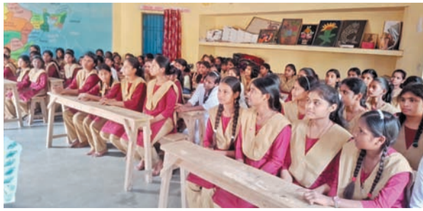
जारी करते हुए कहा है कि स्कूलों में पढ़ने वाले 14 वर्ष से अधिक उम्र के बच्चों की अनिवार्य रूप से टीबी स्क्रीनिंग कराई जाए। साथ ही, जिन बच्चों में टीबी के लक्षण पाए जाएं, उनकी जानकारी तत्काल स्वास्थ्य विभाग को उपलब्ध कराई जाए और उनका इलाज सुनिश्चित किया जाए। इस अभियान में राष्ट्रीय बाल स्वास्थ्य कार्यक्रम (फैडड) की टीम भी सक्रिय रूप से सहयोग करेगी। यह टीम स्कूलों में जाकर बच्चों की जांच करेगी और आवश्यकतानुसार आगे