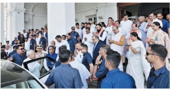
प्रातः किरण संवाददाता

सीएम बोलें- राज्य के विकास में सहयोग व मार्गदर्शन देते रहेंगे