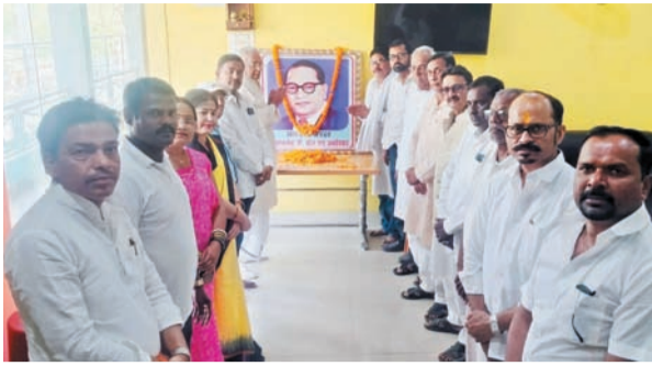
कहा कि उनका जीवन सामाजिक न्याय, समानता और अधिकारों की लड़ाई का प्रतीक है। उनके बताए मार्ग पर चलकर ही एक समतामूलक