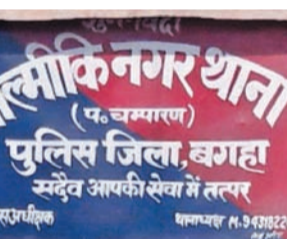
ओर से अब तक किसी को इस घटना के लिए नामजद आरोपी नहीं बनाया