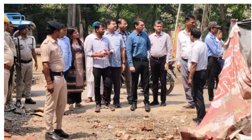
करने का निर्देश दिया, ताकि आने वाले लोगों को किसी प्रकार की असुविधा का सामना न करना पड़े। इस मौके पर अवर निबंधक, आरा सदर, विशेष कार्य पदाधिकारी सहित अन्य संबंधित अधिकारी उपस्थित रहे।

आरा। बुधवार को जिलाधिकारी भोजपुर तनय सुल्तानिया ने रजिस्ट्री कार्यालय स्थित नव-निर्मित पार्किंग स्थल का निरीक्षण किया। निरीक्षण के दौरान उन्होंने संबंधित अधिकारियों को निर्देश दिया कि पार्किंग व्यवस्था को एक सप्ताह के भीतर हर हाल में शुरू किया जाए। जिलाधिकारी ने कहा कि पार्किंग सुविधा के चालू होने से रजिस्ट्री कार्यालय के आसपास लगने वाले जाम की समस्या से आम लोगों को काफी राहत मिलेगी। उन्होंने तय समयसीमा के अंदर सभी जरूरी तैयारियां पूरी करने पर जोर दिया। निरीक्षण के दौरान डीएम ने अधिकारियों को पार्किंग स्थल को व्यवस्थित, सुरक्षित और सुगम बनाने के लिए आवश्यक उपाय सुनिश्चित