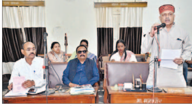
शहर में तेजी से चल रहे हैं। महापौर श्री अन्नू बेहतर पर्यावरण के लिए देश में दूसरा स्थान

महापौर जगत बहादुर सिंह अन्नू ने बताया कि शहर के बुनियादी ढांचे को मजबूत करने के लिए व्यापक कार्य किए गए हैं जिसमें 650 करोड़ की लागत से शहर भर में नाला-नालियों और सड़कों का जाल बिछाया गया है। 100 करोड़ की लागत से उद्यानों का कार्यालय किया गया है। 50 करोड़ रुपये की राशि से जल आपूर्ति व्यवस्था और 20 करोड़ रुपये की राशि से प्रकाश व्यवस्था को आधुनिक बनाने पर व्यय किए गए हैं। उन्होंने बताया कि वर्तमान में करीब 1,000 करोड़ रुपये के विकास कार्य