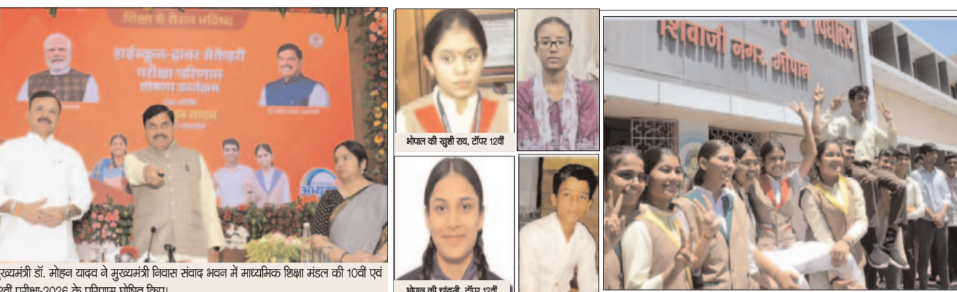
मुख्यमंत्री डॉ. मोहन यादव ने मुख्यमंत्री विकास संवाद भवन में माध्यमिक शिक्षा मंडल की 10वीं एवं 12वीं परीक्षा-2026 के परिणाम घोषित किए।