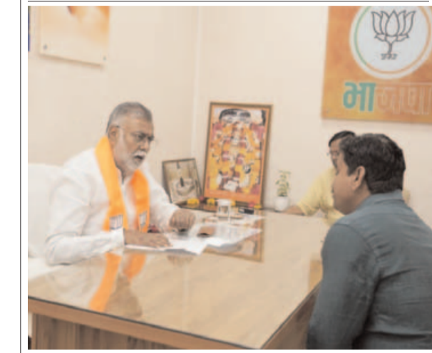
भोपाल, प्रातःकिरण। मध्यप्रदेश शासन के कैबिनेट मंत्री प्रहलाद पटेल ने भाजपा प्रदेश कार्यलय में पार्टी कार्यकर्ताओं और आमजन से संवाद कर उनकी समस्याओं का समाधान किया। जिन समस्याओं का तत्काल समाधान संभव नहीं था, उन्हें संबंधित विभागों को भेजा गया।