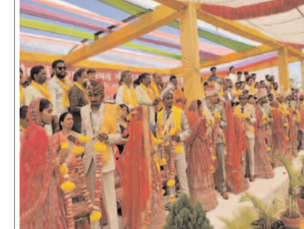
भोपाल, प्रातःकिरण। भोपाल के बिट्टन मार्केट हट बाजार व्यापारी संघ जय में सैफो दुर्गा उत्सव श्री राम रसोई समिति ने सामूहिक विवाह समारोह का आयोजन किया। इस कार्यक्रम में समाज के विभिन्न वर्गों के 11 दर-व्युओं के विवाह संभव हुए। समारोह में सैकड़ों की संख्या में लोग उपस्थित रहे और सभी अतिथियों ने अग्रजों की सराहना की।