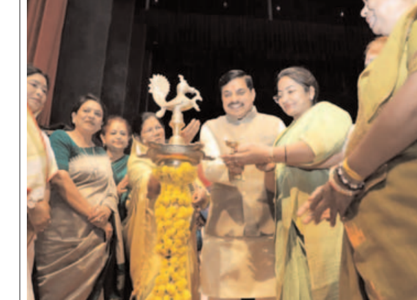
भोपाल, प्रातःकिरण। मुख्यमंत्री डॉक्टर मोहन यादव की उपस्थिति में नारी शक्ति वंदन कार्यक्रम - प्रद्युम्न जन सम्मेलन रसिंद्र भवन के हंस ध्वनि सभागार में बंदे मतरस के गान के साथ आरंभ हुआ। मुख्यमंत्री डॉ यादव ने दीप प्रज्वलित कर कार्यक्रम का शुभारंभ किया।