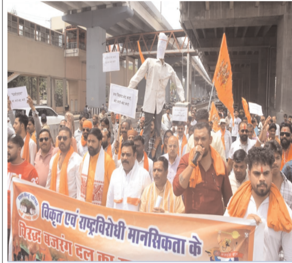
भोपाल.प्रातः किरण। राजधानी में प्रदर्शन 'तब जिहाद' और 'लैंड जिहाद' जैसे शिखरों पर बजरंग दल का हल्लाबोल, दोषियों को चिह्नित कर त्वरित दंडात्मक कार्रवाई की उठाई मांग।

भोपाल.प्रातः किरण। एमएस हॉस्पिटल में चूहे और कॉकरोच की समस्या को लेकर कांग्रेस कार्यकर्ताओं ने चूहे का पित्रार और कीटनाशक स्प्रे लेकर प्रदर्शन किया।