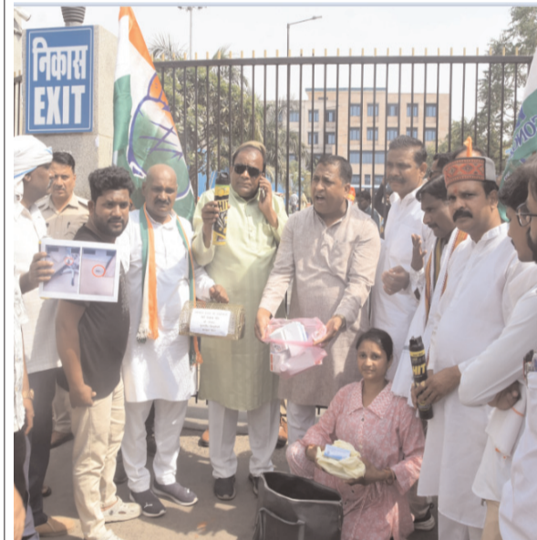
भोपाल.प्रातः किरण। एमएस हॉस्पिटल में चूहे और कॉकरोच की समस्या को लेकर कांग्रेस कार्यकर्ताओं ने चूहे का पित्रार और कीटनाशक स्प्रे लेकर प्रदर्शन किया।