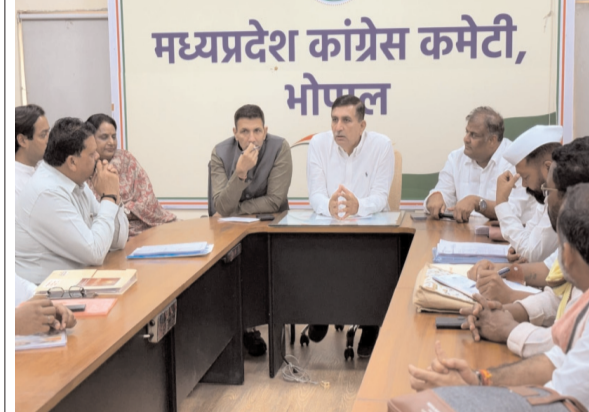
भोपाल.प्रातः किरण। प्रदेश कांग्रेस कार्यालय में बुकवार को जबलपुर और गडचौल संभाग के सभी जिला अध्यक्षों की समीक्षा बैठक आयोजित की गई।