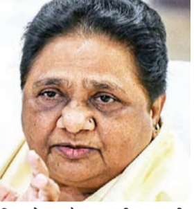
कि देश के एससी, एसटी, ओबीसी समाज के संवैधानिक अधिकारों के मामले में कांग्रेस का रिकार्ड भरोसेमंद नहीं रहा है।

उन्होंने आरोप लगाया कि जब केंद्र में कांग्रेस पार्टी की सरकार थी, तब इन वर्गों को आरक्षण का पूरा लाभ दिलाने के लिए कोई ठोस पहल नहीं की गई। आज महिला आरक्षण के मुद्दे पर कांग्रेस इन वर्गों की बात कर रही है, लेकिन यह उसकी राजनीतिक मजबूती है। उन्होंने आगे कहा कि ओबीसी समाज को सरकारी नौकरियों और शिक्षा में 27 प्रतिशत आरक्षण वीपी सिंह की सरकार में लागू हुआ, जो बसपा के प्रयासों का परिणाम था।