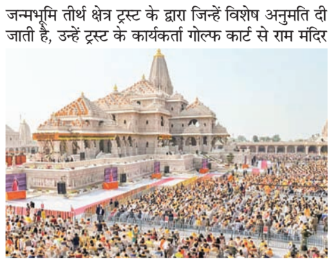
के पश्चिम रास्ते से ले जाकर शोषावतार मंदिर पहुंचाते हैं। पुनः उन्हें पैदल घुमाकर दर्शन कराया जाता है। यह सुविधा सीमित वीवीआईपी के लिए ही है। शेष श्रद्धालु इससे वंचित हैं। खास बात यह है कि सुगम व विशिष्ट दर्शन

अयोध्या, एजेंसी। अयोध्या में श्रीराम जन्मभूमि परिसर के सभी मंदिरों में दर्शन शुरू हो गया है। बीते दिनों की इस व्यवस्था में उत्तर के अलग-अलग दो प्रवेश द्वारों तथा रंगमहल बैरियर व राम गुलेला-अमावां राम मंदिर में विशिष्ट एवं सुगम पास धारकों का प्रवेश हो रहा है। सुगम व विशिष्ट पास धारकों के पास के लिए फिलहाल किसी नये साफ्टवेयर का प्रयोग नहीं हो रहा है बल्कि पुराने साफ्टवेयर से पास जारी किया जा रहा है। यही बल्कि है कि सुगम व विशिष्ट पास पर रामलला व राम परिवार दर्शन ही लिखा जा रहा है। यह अलग बात है कि 13 अप्रैल से सभी मंदिरों में दर्शन खोले जाने के बाद सुगम व विशिष्ट पास धारकों को परकोटे के सभी छह मंदिरों में अतिरिक्त रूप से दर्शन की अनुमति ऐच्छिक रूप से दे दी गयी है। फिर भी इन पास धारकों को शोषावतार, सप्त मंडपम व कुबेर नवल टोला में कुबेरेश्वर महादेव के दर्शन का नाम तो कोई रास्ता निर्धारित किया गया है और न ही उन्हें इन स्थानों पर जाने की इजाजत है। श्रीराम