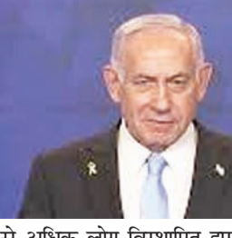
से अधिक लोग विस्थापित हुए हैं। संगठन ने बयान में कहा, 'इस युद्धविराम का उपयोग नागरिकों की सुरक्षा, निरंतर मानवीय सहायता सुनिश्चित करने और स्थायी शांति की नींव रखने के लिए एक महत्वपूर्ण अवसर के रूप में किया जाना चाहिए।' संगठन ने सभी पक्षों से संयम बरतने और ऐसे राजनीतिक मार्ग पर चलने का आग्रह किया जो आगे और